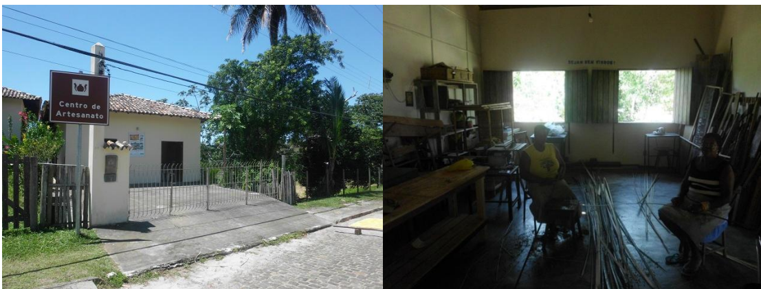
(Centro de Artesanato)

Zudem wird in einem kleinen Nachbargebäude kostenloser Musik -, Tanz – und Computerunterricht sowie Einstiegskurse in in Englisch gegeben.