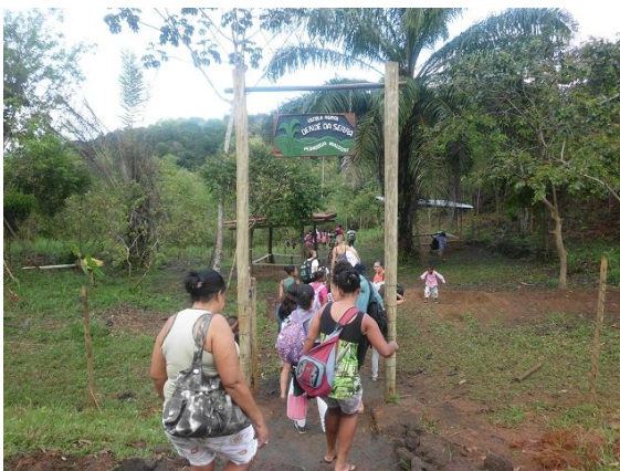
(Eingang zur Escola Rural Dendê da Serra )

Etwas außerhalb der Stadt befindet sich die Escola Rural Dendê da Serra . Diese Waldorfschule ist ein Projekt, welches 2001 realisiert wurde. Mittlerweile wird die Waldorfpädagogik dort vom Kindergarten bis zur 8. Klasse angeboten. Viele Schülerinnen und Schüler kommen aus ärmeren Familien, daher wird die Schule von der Associação Pedagógica Dendê da Serra finanziert und erfährt überdies auch teilweise Unterstützung von privaten Förderern.