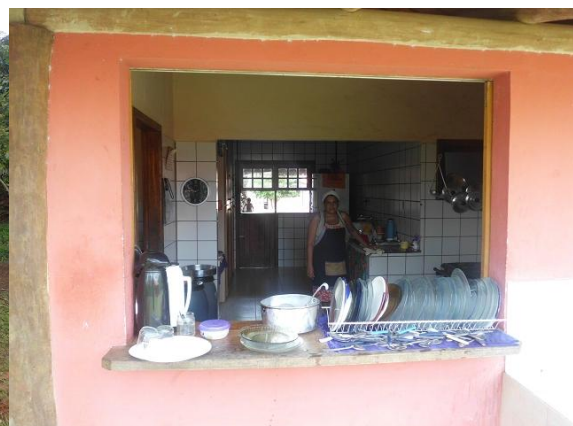
(Küche der Schule)