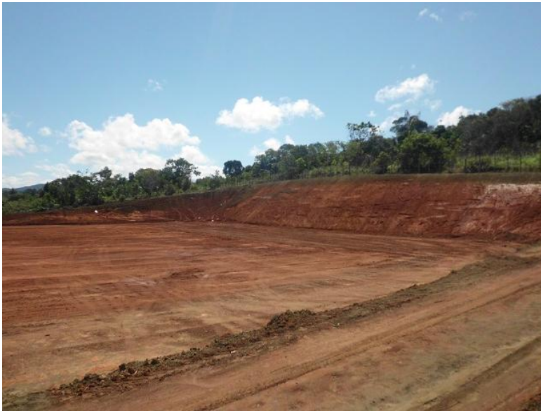
(Bau des Fussballplatzes)

Bevölkerung bezüglich des Baus ist gespalten, da hier in eine relativ große bewaldete Fläche eingegriffen wurde.