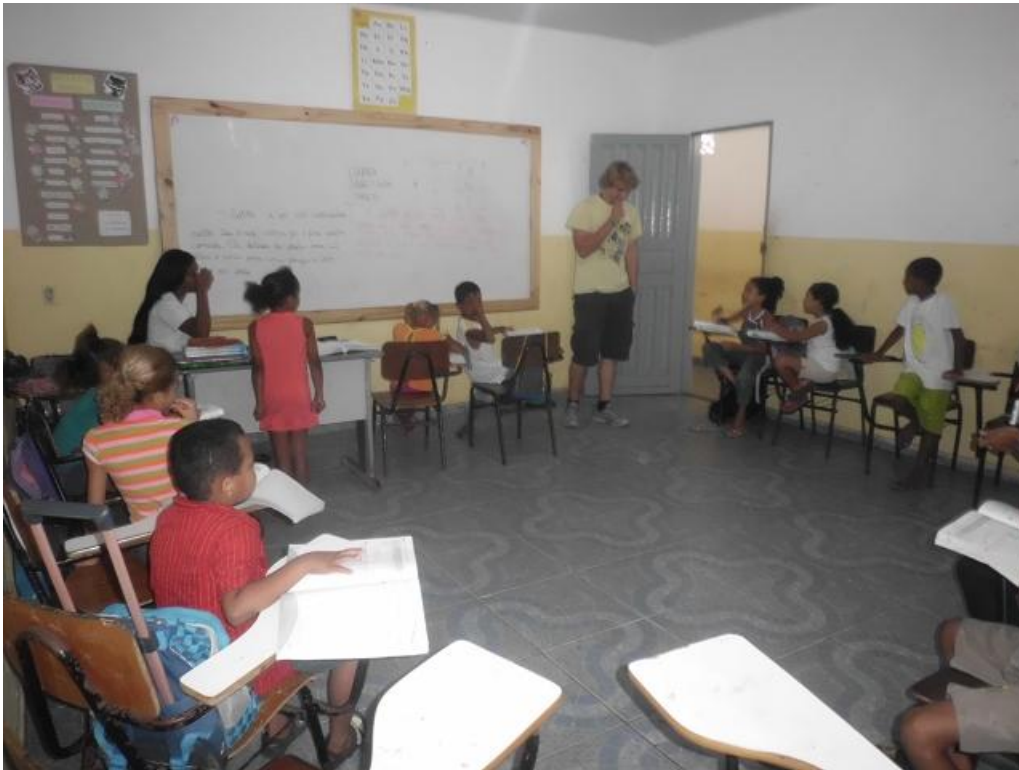
(Besuch einer 1.Klasse der öffentlichen Schule)

Direkt in der Nähe der Schule, auch am Praça befindet sich das Centro de Artesanato , wo Gegenstände u.a. aus Bambus hergestellt werden, die dort auch zu erwerben sind. Das Zentrum wird von den Irmãs geleitet, eine christliche Einrichtung, die einige kleine Projekte fördert.