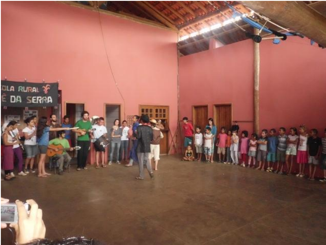
(Vorführung eines Theaterstückes im Vorhof der Schule)